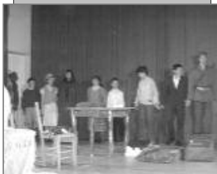
“Кирија” - ИО Виска..