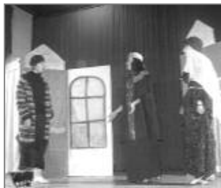
Из представе “Зачарани краљица”