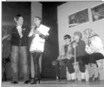
“Ординација”, ОШ Латвица