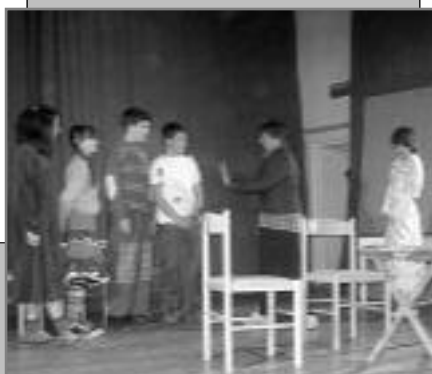
“Кирија” - ИО Трешњевица