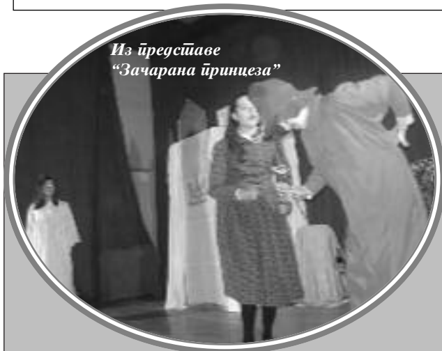
Из представе "Зачарана принцеза"